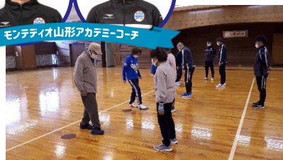
モンテディオ山形アカデミーコーチ

参加をご希望の方は、11月15日(火)までに、下記連絡先にお名前をお知らせください。